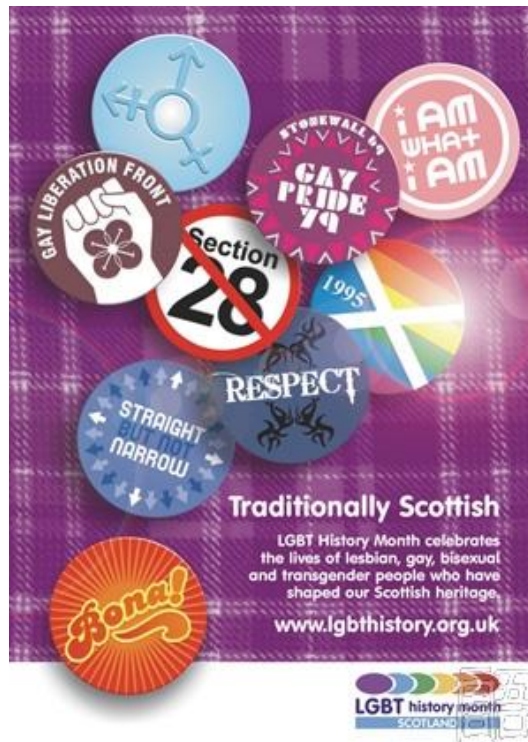
苏格兰同志历史月活动的系列徽章

同志历史月 LGBT History Month （美国为每年十月，英国为每年二月）这个为期一月的年度活动旨在铭记男女同性恋、双性恋、跨性别的历史，以及同志平权运动和更广泛的平等权益运动的发展。在美国，同志历史月为每年的十月，最早由密苏里的高中历史教师 Rodney Wilson 发起，后来又增加了 10 月 11 日的“全国出柜日”(National Coming Out Day)。在英国，同志历史月则为每年的二月，源于 2005 年 2 月对废除“条款 28”的庆祝活动，该条款禁止在学校中谈论同志议题，禁止为同志或有身份疑问的青少年提供咨询。历史月期间，将举行一系列的纪念和宣导活动。