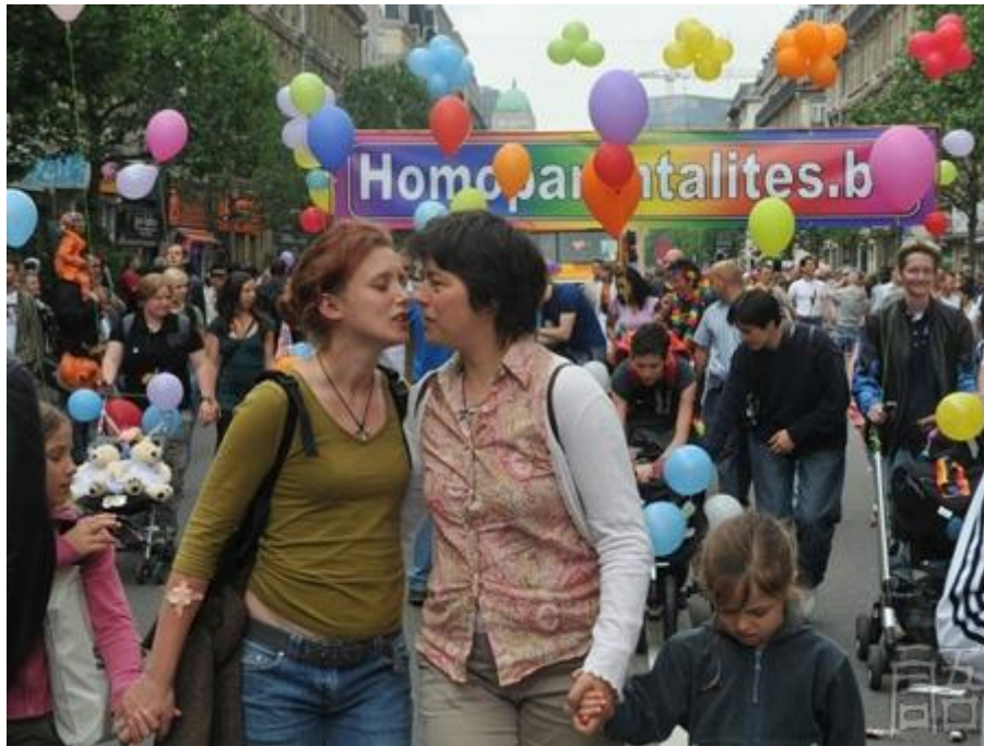
国际不再恐同日游行活动中的一对女同伴侣和她们的孩子，比利时首都布鲁塞尔

国际不再恐同日 International Day Against Homophobia (5月17日) 1990年5月17日，世界卫生组织正式将“同性恋”从精神疾患的名单上剔除，同性恋非病理化得到国际医学界的正式承认，这标志着一个多世纪以来医学界恐同的终结，性倾向和性别认同的自由作为一项基本人权，正在向国际认可迈进。当前，世界上仍有7个国家对同性恋者处以死刑，另有80多个国家把同性恋视为犯罪。在绝大多数国家，男女同性恋者、双性恋者、跨性别者等性少数人群被相关国际公约所承认的基本人权并未得到实际保障。国际不再恐同日源于2003年加拿大的“全国不再恐同日”和2005年法国大学教授和社会活动家 Louis-Georges Tin 的倡议，旨在创造一个没有同性恋恐惧、也没有跨性别恐惧的世界，团结积极分子和热心民众为实现这一目标而共同奋斗，让所有人都能够自由地选择自己的社会性别身份、实现性的自主。