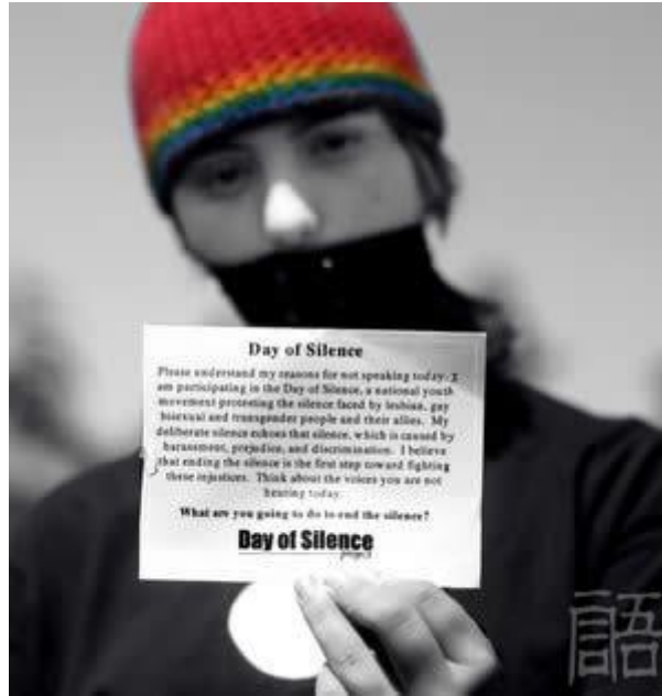
亮出卡片，无声控诉

同志历史月 LGBT History Month （美国为每年十月，英国为每年二月）这个为期一月的年度活动旨在铭记男女同性恋、双性恋、跨性别的历史，以及同志平权运动和更广泛的平等权益运动的发展。在美国，同志历史月为每年的十月，最早由密苏里的高中历史教师 Rodney Wilson 发起，后来又增加了 10 月 11 日的“全国出柜日”(National Coming Out Day)。在英国，同志历史月则为每年的二月，源于 2005 年 2 月对废除“条款 28”的庆祝活动，该条款禁止在学校中谈论同志议题，禁止为同志或有身份疑问的青少年提供咨询。历史月期间，将举行一系列的纪念和宣导活动。