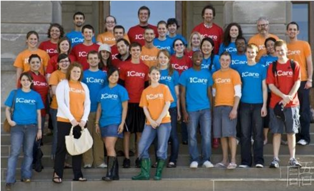
身穿 I Care（我关心）T 恤的盟友周活动参与者

盟友周 Ally Week（10月13日至17日，始于2005年） 盟友周是美国一个由青年主导的活动，旨在鼓励从幼儿园到高中的在校学生成为支持同志、反对恐同言行的同志盟友。它的发起者是美国“同志和直人教育网络”（Gay, Lesbian and Straight Education Network, GLSEN）的一群年轻人，以争取广泛社会支持，发展直人同盟者，特别是在青少年中倡导文化多样、社会宽容和权益平等的理念。